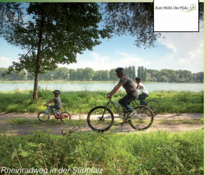
Rheintalradweg in der Pfalz

Die Pfalz zeigt landschaftlich viele Gesichter. Vom Rebermeer mit den idyllischen Weindörfern an der Deutschen Weinstraße über das Biosphärenreservat Pfälzerwald und einer Vielzahl von Burgruinen oder den Städten, wie z.B. Speyer oder Zweibrücken, mit ihren kulturellen Attraktionen. So vielfältig wie die Landschaft der Pfalz sind auch die Möglichkeiten, diese traumhafte Landschaft im Urlaub zu genießen. Per Rad lässt sich diese kulturelle Vielfalt mit den unvergleichlichen Gaumenfreuden optimal verbinden. Das Biosphärenreservat Naturpark Pfälzerwald ist ein Paradies für Mountainbiker. Familien, Genussradlerinnen und Genussradler kommen auf einem der unzähligen Themenradwege auf ihre Kosten. Pfalz.Touristik e.V. Martin-Luther-Straße 69 • 67433 Neustadt an der Weinstraße +49 (0)6321 39160 www.pfalz.de