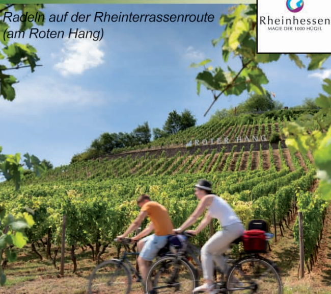
Radeln auf der Rheinterrassenroute (mit Roten Hang)

Die Landschaft Rheinessens, des größten deutschen Weinanbaugebietes, erstreckt sich als sanftes, von Weinbergen bedecktes Hügelnd vom Rhein aus bis zu den Ausläufern des Nordpfälzer Berglands, der Rheinischen Schweiz. Auch Radfahrerinnen und Radfahrer auf ihrer Tour von Winzerhof zu Winzerhof machen dort Rast. Auf gut beschilderten Themenrouten können Radfahrerinnen und Radfahrer Rheinessen entdecken. So ist z.B. die Obstroute Rheinessen während der Obstbaumblüte im Frühjahr besonders schön. In vielen rheinischen Orten stoßen die Gäste auf blühende Bauergärten, mediterran gestaltete Höfe und gepflegte Rosengärten, und häufig wird dort auch eine zünftige Winzerverstärkung mit einem Glas Rheinessenwein oder selbstgebackener Kuchen serviert.