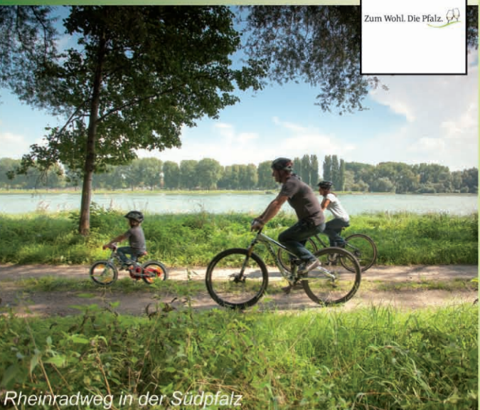
Rheinradweg in der Südpfalz

Die Pfalz zeigt landschaftlich viele Gesichter. Vom Rebenmeer mit den idyllischen Weindörfern an der Deutschen Weinstraße über das Biosphärenreservat Pfälzerwald und einer Vielzahl von Burgruinen oder den Städten, wie z.B. Speyer oder Zweibrücken, mit ihren kulturellen Attraktionen. So vielfältig wie die Landschaft der Pfalz sind auch die Möglichkeiten, diese traumhafte Landschaft im Urlaub zu genießen.